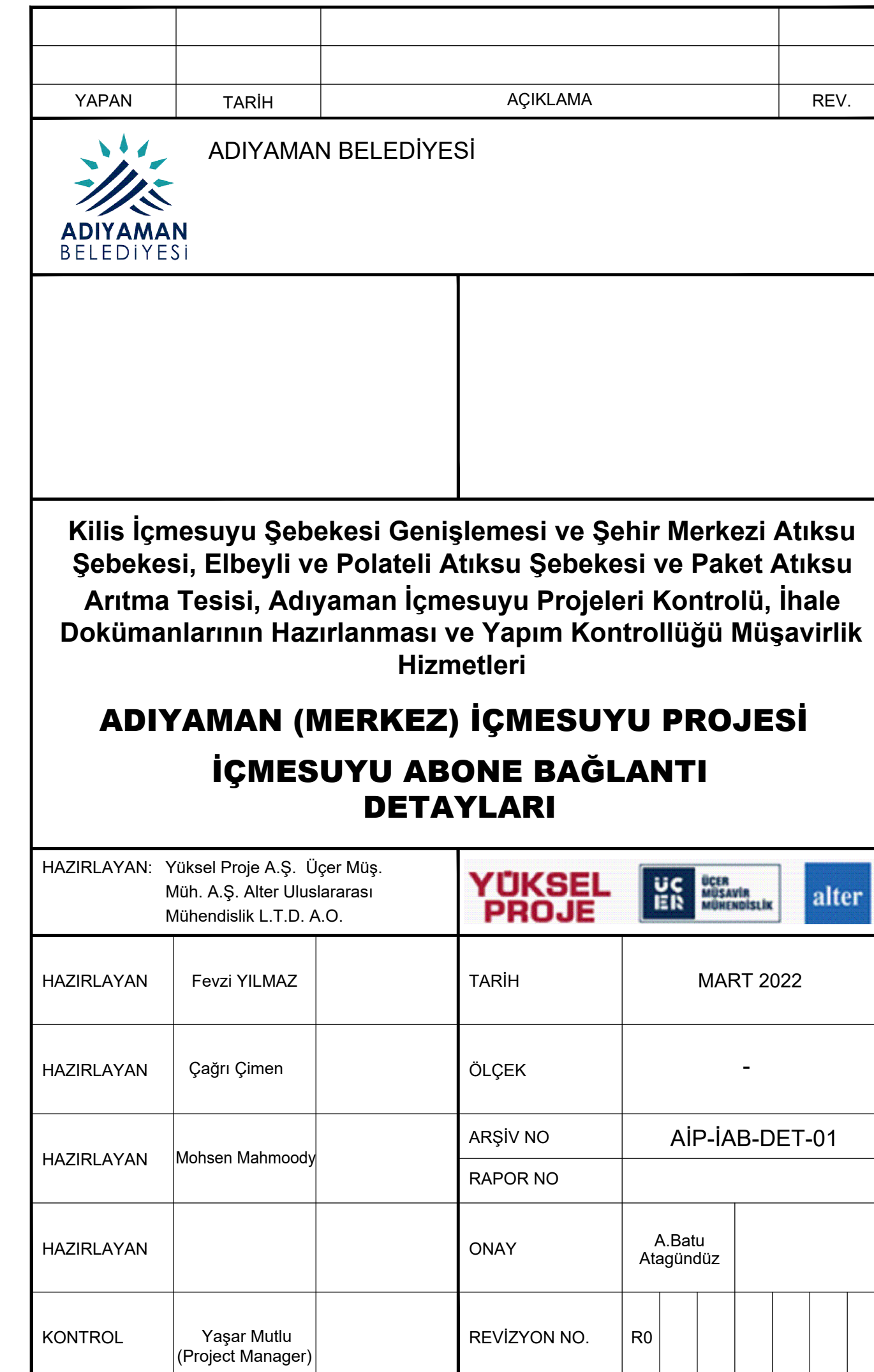
İÇMESUYU ABONE BAĞLANTI DETAYLARI